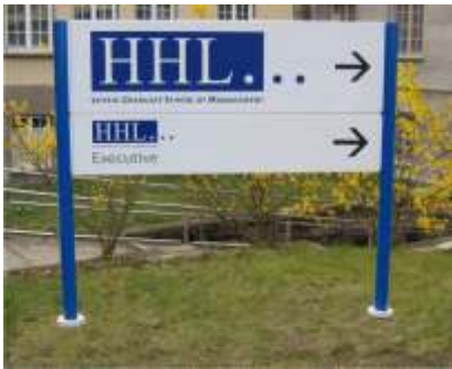
Außenständer mit Rundrohr-Trageelementen