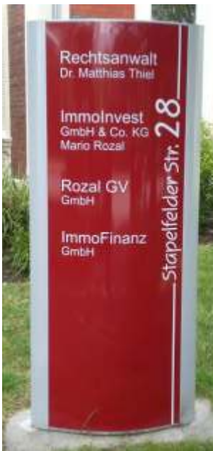
Pylon vollflächig hinterleuchtet