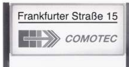
Außeninfoständer mit Leuchtrtransparent