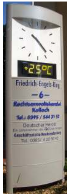
Pylon mit Sonderausstattung