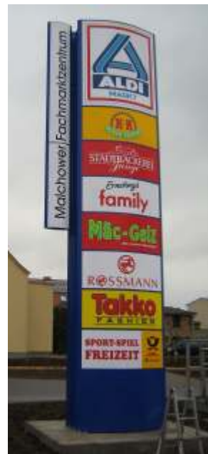
Pylon mit Ausstecktransparent