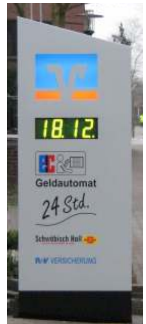
Stele in Sonderform mit LCD-Anzeige