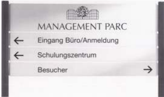
Außeninfoständer mit formschönen Achteckrohren

Bei der Gestaltung Ihrer Außeninformation als Standardprodukt oder individuelle Sonderlösung, die wir maßgeschneidert für unseren Kunden entwickeln, lässt TERRA Ihnen freie Hand: Die Materialauswahl reicht von Aluminium, Lochblech, Glas, Acrylglas bis Edelstahl. Kombinationen dieser Materialien sind natürlich ebenso möglich. Und welche Form soll es sein? Konvex, konkav, plan, quadratisch, rechteckig - oder ganz anders? Für die Farbgebung stehen neben Eloxalfarben die gesamte RAL-Design-Palette zur Verfügung.