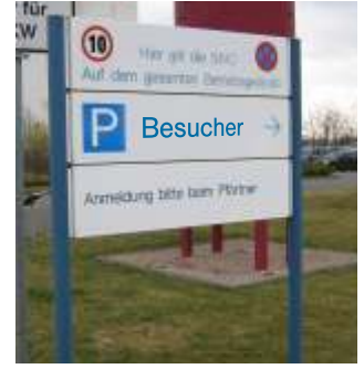
Außenständer mit 3 austauschbaren Infoblöcken