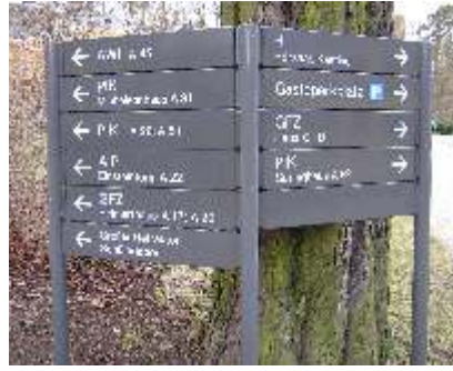
kombinierter Außenständer mit 3 Rundrohr-Trageelementen